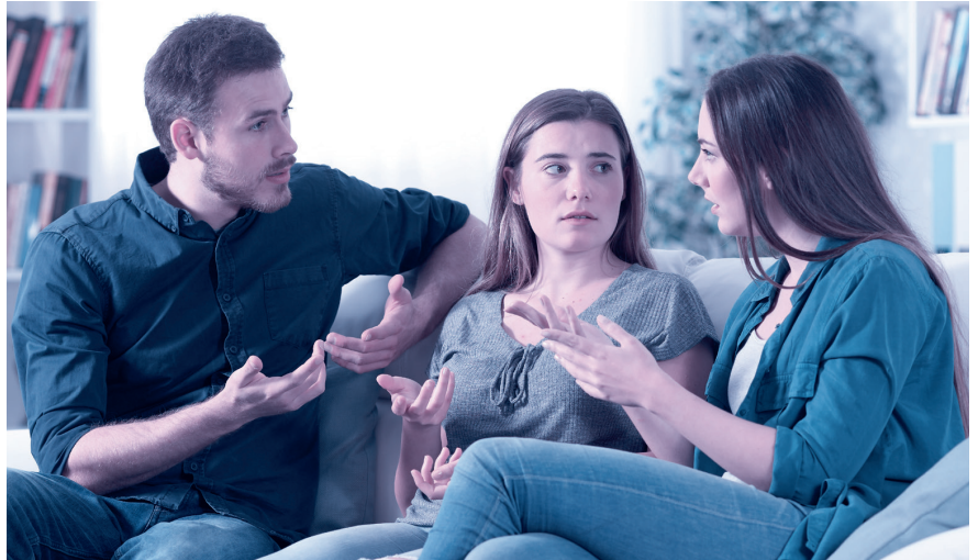
Kommt es zum Streit zwischen den Erben, muss der Willensvollstrecker schlichten.

Der Willensvollstrecker setzt den letzten Willen des Erblassers um. Dafür stellt er als Erstes ein Inventar auf, das er laufend nachführt. Er verwaltet die Erbschaft bis zur Teilung und muss darauf achten, dass das Vermögen erhalten bleibt. Er bezahlt die Schulden des Erblassers inklusive der Todesfallkosten und treibt offene Forderungen ein. Zur Verwaltung gehören auch die laufenden Geschäfte, beispielsweise muss er sich um den Unterhalt von Liegenschaften kümmern, laufende Verträge kündigen oder allenfalls die Liquidation einer Einzelunternehmung umsetzen. Er ist verantwortlich für die Erstellung der