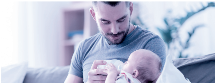
Vaterschaftsurlaub: innert sechs Monaten nach der Geburt zu beziehen.

Das Unternehmen muss dem Vater zehn arbeitsfreie Tage gewähren und hat für diese Zeit Anspruch auf 14 Taggelder. Es ist Sache des Arbeitgebers, bei der Ausgleichskasse – welche auch die EO-Beiträge abrechnet – den Antrag auf die Vaterschaftsentschädigung zu stellen. Der Antrag sollte aber erst gestellt werden, wenn der Arbeitnehmer den ganzen Vaterschaftsurlaub bezogen hat und der Arbeitgeber dies mit dem Antrag bestätigen kann. Die Auszahlung der Vaterschaftsentschädigung erfolgt dann nachgelagert